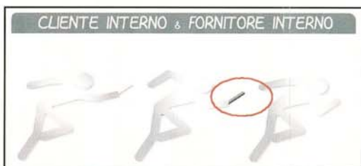
Fig. 3 – Processo: il singolo nel gruppo (da E. Leonardi "Ricostruire e vivere il processo", Sperling & Kupfer, 2005)

meccanica, alla fine della rappresentazione, ci fu molta esultanza (! ? !) quando un tecnico disse: "Ecco perché le modifiche del progetto arrivano quando il pro-