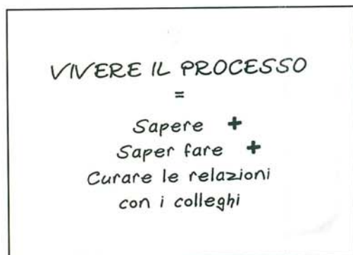
Fig. 1 - L'ottica di processo (da E. Leonardi "Ricostruire e vivere il processo", Sperling & Kupfer, 2005)

Risulta di grande aiuto in questo lavoro di riesame critico, analizzare il processo anche nella sua forma grafica: un diagramma di flusso a matrice, dove prioritariamente viene dato spazio agli attori con evidenza delle attività di pertinenza (fig. 2). Mi è capitato più volte di rilevare che da un testo discorsivo di una procedura non si potesse ricavare il flusso. Questo perché nella descrizione narrativa eventuali assenze di passaggi di informazioni o rischi di fraintendimenti possono non venire alla luce, mentre la descrizione grafica del flusso di attività non consente omissioni o equivoci. Altro aspetto a favore di questa forma di comunicazione è legato al fatto che assumono forte risalto, in modo inequivocabile,